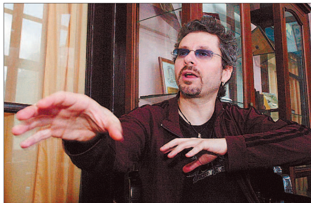
El director de cine estará en el estreno.

un autobús que saldrá desde el Centro de Creación Musical Hangar a las 17.30 horas, con un bono que incluye entrada, obsequio de CD y desplazamiento Burgos-Madrid-Burgos por 8 euros (5 euros para los titulares de tarjetas de Caja de Burgos). Las entradas ya están a la venta en las taquillas del Hangar, Cultural Cordón y en el servicio Web TeleEntradas Caja de Burgos. Se trata del segundo dis-