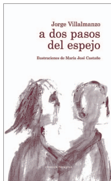
En la presentación del libro actuará el grupo El Cencerro Eléctrico.

EL CENCERRO ELÉCTRICO. A dos pasos del espejo se presentará el próximo sábado día 28 en las navas de la imprenta I-Print (Pentasa 3), empresa que colabora en la edición del libro. Además de los autores, en el acto participará El Cencerro Eléctrico en una de sus últimas actuaciones antes de la presentación de su primer disco, Y si cacarean (20:30 horas).