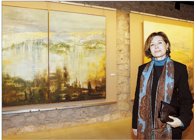
La artista muestra la obra que expuso en el Arco en 2004. / ÁNGEL AYALA

En la muestra que ahora presenta en Valladolid, y que permanecerá abierta durante un mes, se aprecian todos estos matices de una pintora marcada por la sensibilidad, una paleta de colores muy concreta y un paisaje a medio camino entre lo vivido y lo soñado, donde la figura humana solo se presiente.